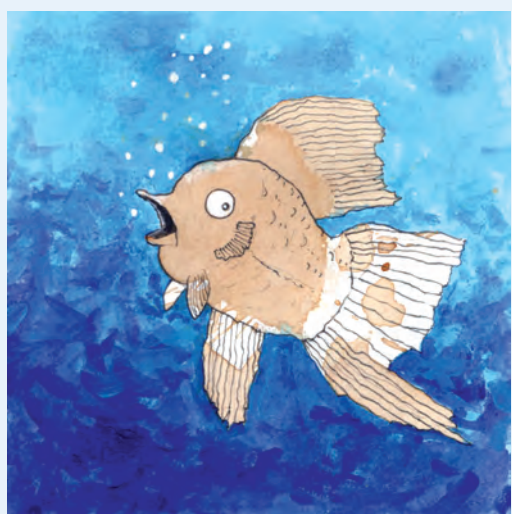
„Fisch“ von Wolfgang Slawski, Wischhofstraße 1-3, Gebäude 4, 2. Stock