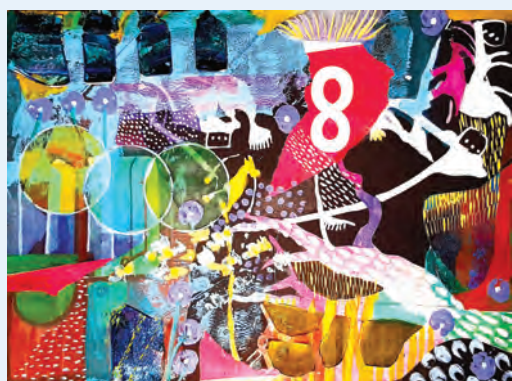
„Acht Kostbarkeiten“ von Beate Ebert, Ateliers am Werftpark, Kaiserstraße 4