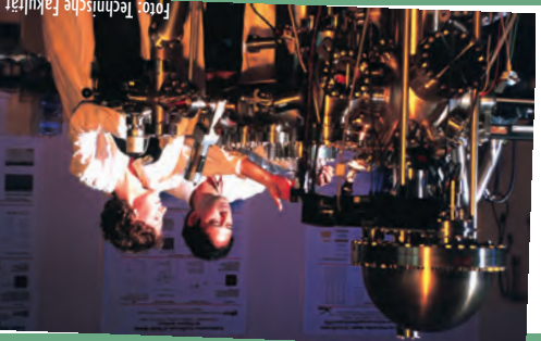
Mal hinter die Kulissen schauen: Die lange Nacht der Wissenschaft macht's möglich

Obolus - die Sozialäden Bekleidung, PC- und Elektroartikel, Haushaltswaren, Schulbedarf sowie Spiele und Spiel-Kiefern und Kieler in den Obolus-Läden zu sehr günstigen Preisen. Ermöglicht wird dies durch großzügige Spenden von Kieler Mitbürgerinnen und Mitbürgern. Seit April ist Obolus auf dem Kieler Ostfer zweimal vertreten: Nach der Dietrichsdorfer Filiale in der Hertzstraße 75 hat in der Johannessstraße 48 eine Gaardener Filiale eröffnet. Wer gute und gebrauchsfähige Ware abzugeben hat, kann einfach während der Öffnungszeiten dort vorbeischauen. Im Moment werden besonders Übergangs- und Winterkleidung, aber auch Überböden und Elektrokleingeräte benötigt. Weitere Infos auf: www.obolus-kiel.de Obolus ist ein Projekt der Fortbildungskademie der Wirtschaft (FAW) gGmbH im Auftrag des Jobcenters Kiel. siso