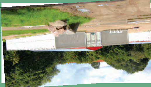
Ab Dienstag, 6. September, ist Einzug. Am 5. September ist Zeit, Fragen zu stellen und sich selbst ein Bild zu machen vom neuen Containerdorf.

Speziell für die Grundschulen des Ostfers sucht die Initiative zusätzliche Aktive. Die ehrenamtliche Leselernhilfe-Initiative möchte bei Kindern die Freude am Lesen wecken und so die Lesekompetenz von Grundschulkindern fördern. Die Lesestunden mit den Mentoren sind nicht als Nachhilfe gedacht, sondern als Ergänzung zum Unterricht. Jeder Mentor gestaltet einmal wöchentlich für „sein“ Kind eine individuelle Lesestunde in der jeweiligen Schule. Künftige Mentoren brauchen: Spaß am Umgang mit Kindern und am Lesen • Sicherheit in der deutschen Sprache • Verantwortungsbewusstsein • Zuverlässigkeit • Geduld • Ausdauer • ein polizeiliches Führungszeugnis Info: MENTOR-Kiel, Tel. 0431/70 999-19 info@mentor-kiel.de