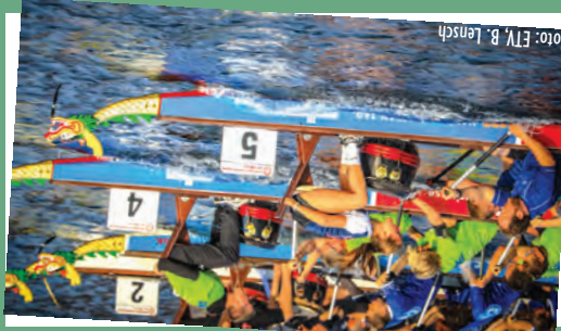
Voller Einsatz: Am 9. & 10. September ist Drachenbootrennen. 105 Teams sind für den FunCup am Samstag gemeldet.

Obolus - die Sozialäden Bekleidung, PC- und Elektroartikel, Haushaltswaren, Schulbedarf sowie Spiele und Spiel-Kiefern und Kieler in den Obolus-Läden zu sehr günstigen Preisen. Ermöglicht wird dies durch großzügige Spenden von Kieler Mitbürgerinnen und Mitbürgern. Seit April ist Obolus auf dem Kieler Ostfer zweimal vertreten: Nach der Dietrichsdorfer Filiale in der Hertzstraße 75 hat in der Johannessstraße 48 eine Gaardener Filiale eröffnet. Wer gute und gebrauchsfähige Ware abzugeben hat, kann einfach während der Öffnungszeiten dort vorbeischauen. Im Moment werden besonders Übergangs- und Winterkleidung, aber auch Überböden und Elektrokleingeräte benötigt. Weitere Infos auf: www.obolus-kiel.de Obolus ist ein Projekt der Fortbildungskademie der Wirtschaft (FAW) gGmbH im Auftrag des Jobcenters Kiel. siso