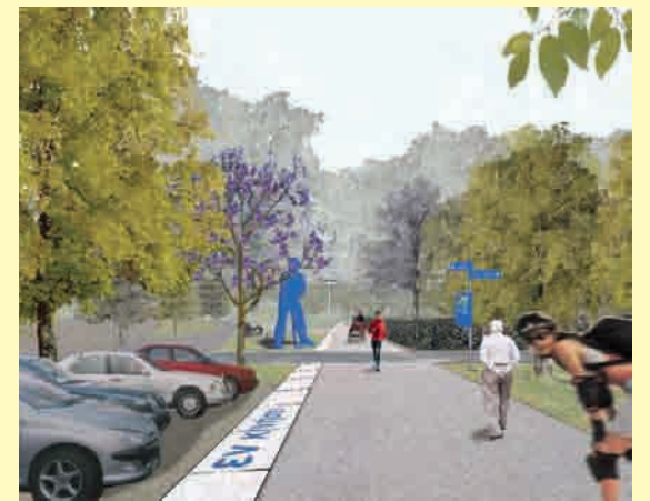
Skulptur sowie wegbegleitende Informationen nahe des Gertrud-Völker-Hauses.

Weiterer Bestandteil des Entwurfs ist auch ein Informationssystem, das den Besuchern durch mehrsprachige Angaben, auf Tafeln und im Boden eingelassen, die Orientierung erleichtert. (jk)