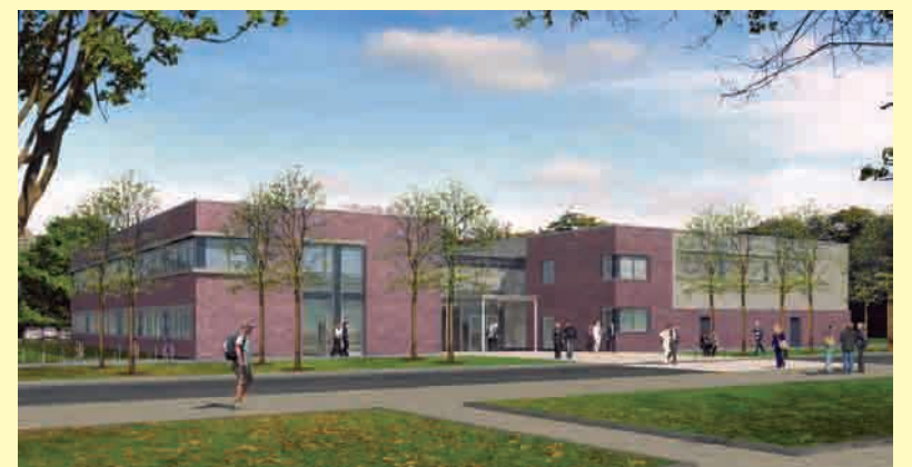
2010 wird es seine Tore öffnen: Das neue Audimax der FH Kiel.

Insgesamt investiert das Land in diesem Jahr rund 15 Millionen Euro in die Fachhochschule Kiel für den Neubau des Mehrzweckgebäudes und des Studienkollegs, die Modernisierung des Datenetzes sowie für den Umbau des Bunkers.