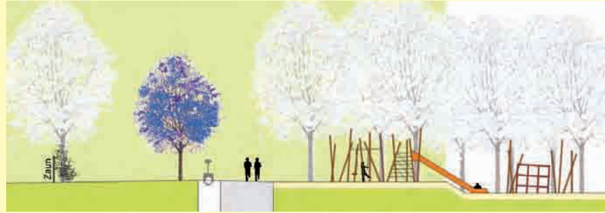
Querschnitt des Bereiches oberhalb des Coventryplatzes nach der Umgestaltung.

Im Rahmen des Auswahlverfahrens sind in den vergangenen Wochen vier Büros beauftragt worden, die Umgestaltung des ersten Abschnitts im Sport- und Begegnungspark zu Papier zu bringen. Hier wurden die vier Planungsbüros aus Flensburg, Berlin, Hannover und Lübeck von Vertretern aus Politik, Verwaltung und lokalen Akteuren mit den wesentlichen Informationen zum Stadtteil, seinen Bewohner/innen sowie auch zu den beteiligten Vereinen und Institutionen aus Gaarden versorgt. Auf dieser Basis entwickelten die vier Büros erste Entwürfe und Konzeptionen, die an einem zweiten Termin präsentiert wurden. Dort hatten die Anwesenden die Möglichkeit, weitere Hinweise zu geben und gegebenenfalls erste Punkte der