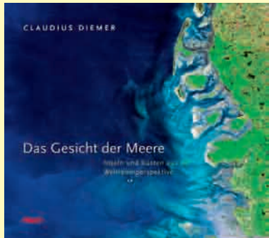
Zu sehen im IFM-GEOMAR Seefischmarkt, Wischhofstr. 1-3