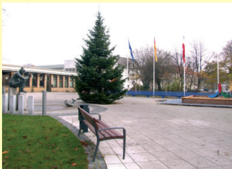
Auch der neu gestaltete Tilsiter Platz ist in diesem Jahr weihnachtlich geschmückt...

Insgesamt 6 große Weihnachtsbäume schmücken in diesem Jahr die Plätze der Ostufer-Stadtteile und sorgen so für weihnachtliche Stimmung. Außer auf dem Vinetaplatz (mit gleich zwei Bäumen) und im Wellingdorfer Zentrum stehen auch auf dem Ellerbeker Rohdehoffplatz und auf der Schwentinehalbinsel große Tannen. Und zum ersten Mal wird auch der neu gestaltete Tilsiter Platz mit einem Baum geschmückt. Für die vielen schönen Bäume geht ein großer Dank an das Grünflächenamt der Landeshauptstadt Kiel.