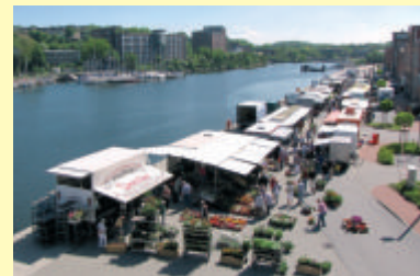
Immer am Freitag: buntes Marktreiben vor malerischer Kulisse

- auch das Theater Kiel bekommt dort eine neue Probebühne. Über das neueste Vorhaben freut sich vor allem die ansässige Fischwirtschaft: Die alte Fischauktionshalle wird auf den neuesten Stand gebracht. Auf der Liste steht neben einem verbesserten Brandschutz und Barrierefreiheit vor allem ein modernes Energiekonzept. Ein gutes Beispiel dafür, dass sich die Kultur in diesem lebendigen Umfeld wohlfühlt, ist die Galerie am Seefischmarkt, die im Gebäude 10 spannende Ausstellungsprojekte realisiert. 2012 ist „Expansion“ das Thema - dann werden auch die Außenflächen und die Fischhalle mit einbezogen. Schauen Sie mal vorbei auf dem Seefischmarkt - auf einen Kaffee im Bistro, Freitagfrüh auf dem Wochenmarkt, bei einer Ausstellung oder einfach für einen Spaziergang - hier tut sich was. sso