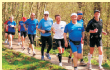
Das Motto: Spaß am Laufen ohne Stress

Wer schon immer mal wieder Joggen gehen oder mit dem Joggen anfangen wollte, wer etwas für seine Kondition und überhaupt mal etwas für seine gesundheitliche Fitness tun und nebenbei vielleicht noch etwas Gewicht verlieren wollte, wer es dann aber irgendwie doch nie geschafft hat, der sollte unbedingt diesen Artikel aufmerksam weiterlesen! Der Lauftreffverein Kiel-Ost (LTV) hat ein perfektes Komplettpaket für sie vorbereitet: