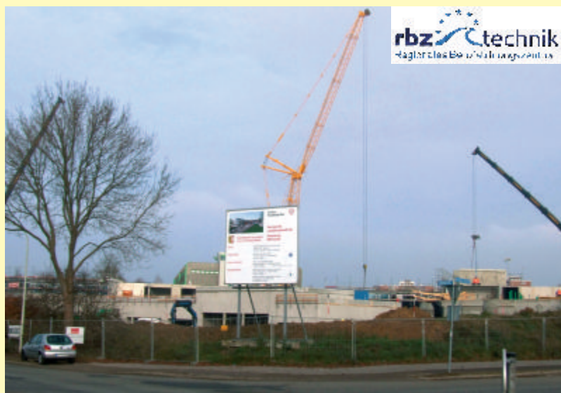
Seit diesem Sommer wird gebaut, schon im Oktober 2012 soll alles bezugsfertig sein.