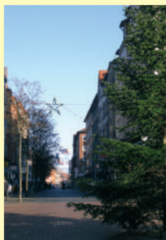
... genauso wie der Gaardener Vinetaplatz